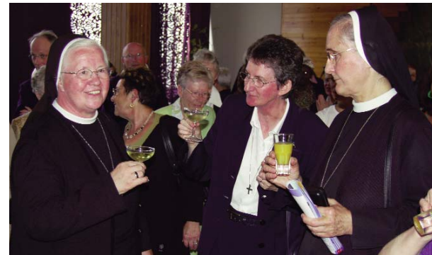
Zeitgeschichtliche Dokumente (oben): Schwestern vor dem Ende der 60er Jahre errichteten Bergkloster Bestwig. Darunter die Begegnung der deutschen und französischen Generalleitung 40 Jahre später in der Normandie. Unten Bilder vom Schwesterntag in Heiligenstadt: Dabei wird nachgespielt, wie der Leiter der Abteilung Volksbildung den Schwestern das Unterrichten verbietet. Auch das ist DDR-Geschichte, aus der Zeitzeuge Hans-Gerd Adler berichtete.