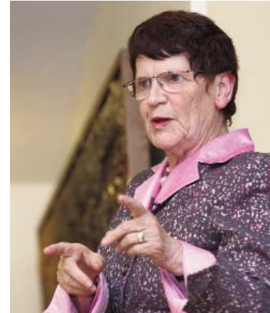
Rita Süßmuth bei ihrem Vortrag in Wadersloh.