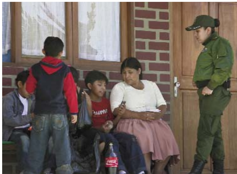
Besuchstag in der Aldea de Niños Cristo Rey: Die Polizei passt auf, dass die Mütter nicht weglaufen.